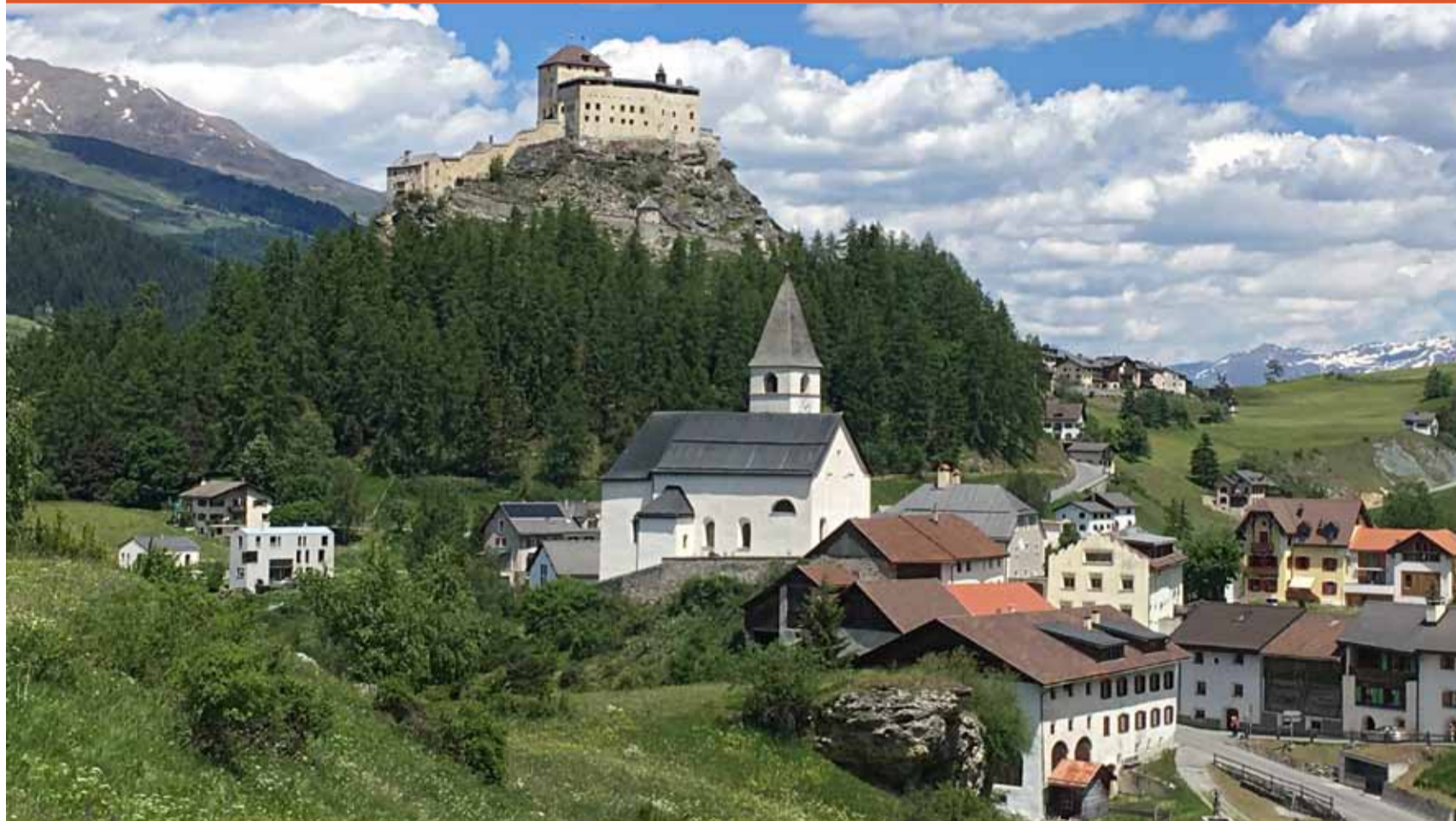
Kirche und Schloss von Tarasp GR als Sinnbild für die traditionelle Nähe von Kirche und Staat